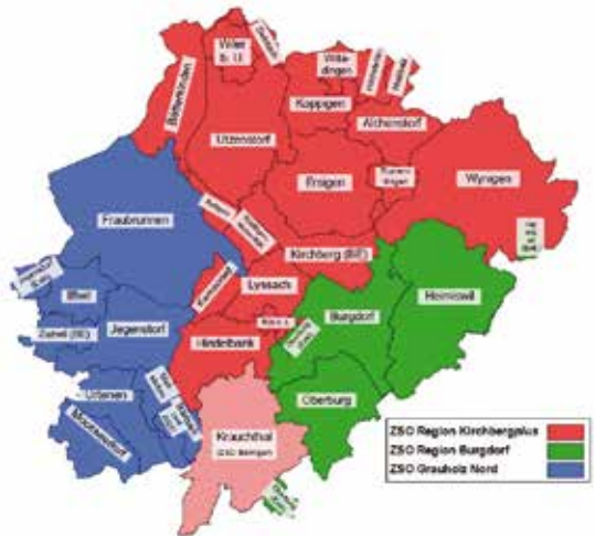
Aktuelle Situation der drei Zivilschutzorganisationen

zur Fusion. Für den Gemeinderat ist klar: «Unsere Gemeinde kann den Auftrag des Zivilschutzes nicht allein erfüllen.»